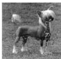
Korrekt, naturlig pårsansättning

"De riktiga nakenhundarna släpps inte fram på utställning"