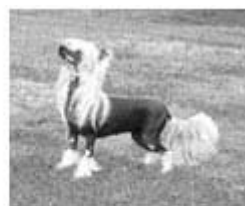
Mycket kraftigt behårad